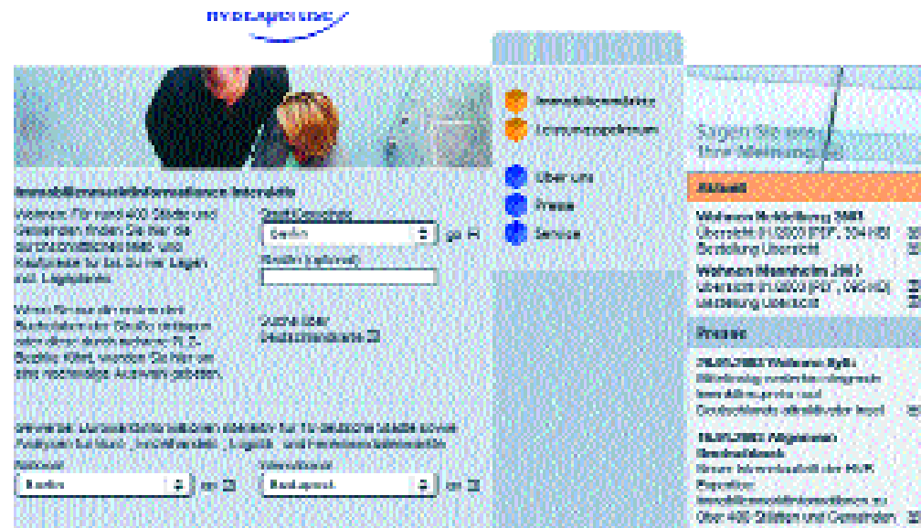
Neue Website der HVB Expertise